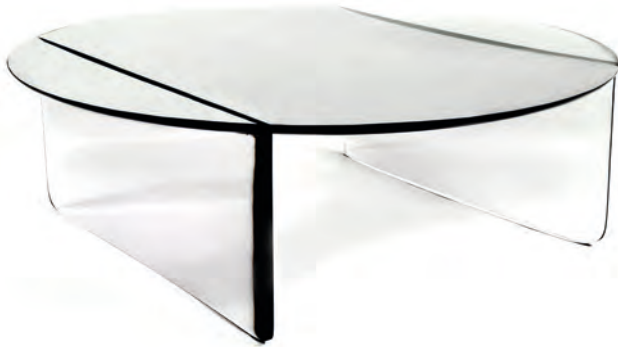
Table basse loupe en polyméthacrylate de méthyle (PMMA) fumé et poli, 2020

Structure en bois, housse en tissu de coton de la société Dedar, imprimé par Prella Atelier de Recherche et de Création et Atelier de tapisserie décor et contemporain